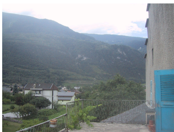
vue au sud-est depuis la terrasse

Un local avec entrée indépendante à l'est de 16 m 2 (hauteur : 4,4 m) permettrait d'imaginer un 2 e logement, avec accès à une grande cave borne au rez de chaussée (surface de 18 m 2 avec une hauteur de 3,9 – 4,2 m). Une chapelle voûtée (11 m 2 ) et un local d'entrée (4 m 2 ) donnant de plein pied sur le jardin sud (302 m 2 avec possibilité de reconstruire une remise de 15 m 2 ) constituent un complément extraordinaire. Trois vieux arbres fruitiers et une haie d'arbustes agrémentent le jardin. De beaux escaliers anciens en pierre, en copropriété, permettent accéder aux différents niveaux.