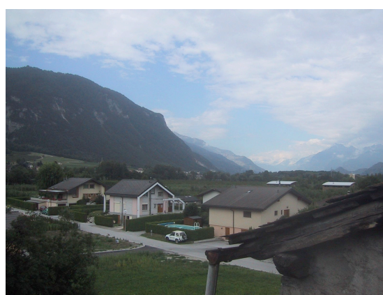
vue au sud-ouest depuis le balcon